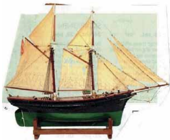
"Brodersminde" af Hasle

Men hvem ejede mon dette skib "Brodersminde" af Hasle, og er der kendskab til flere af den slags små skibe? Er der nogen der ligger inde med oplysninger herom, hører vi gerne om det.