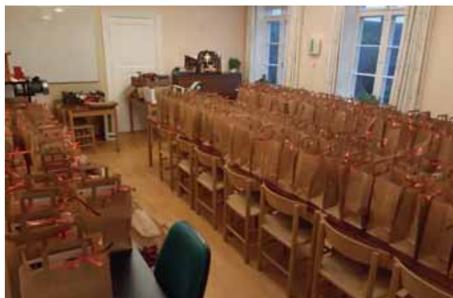
Folkekirken gør klar til Aarets vej