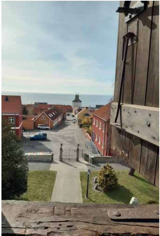
Udsigt fra klokkespiret Hasle Kirke