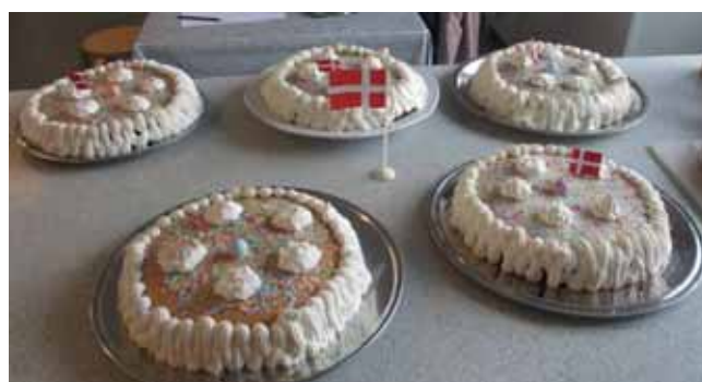
Fælles fødselsdag SFO

Udover de fysiske rammer er der også fokus på det sociale. Den sidste fredag i måneden afholdes "fælles fødselsdag", hvor vi fejrer de børn, der har haft fødselsdag i den aktuelle måned med lagkage