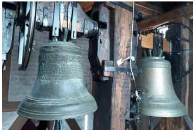
Kom for alt er rede - kalder den store klokke fra 1996

9.00 Fællesgudstjeneste i Rutsker, Elon Lauterlein