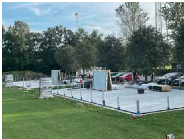
Padel baner undervejs

Sidste år på dette tidspunkt skrev jeg også om Padel Tennis.